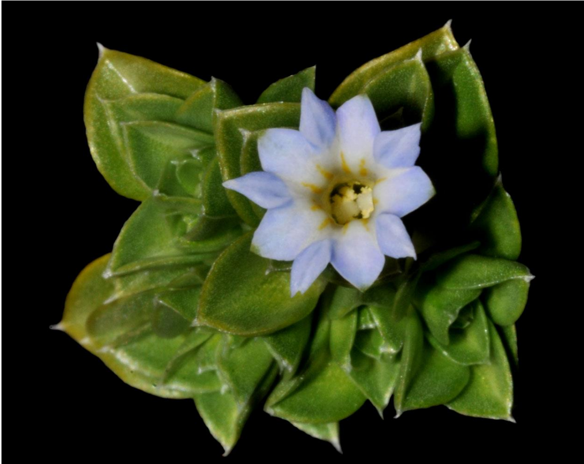
“ Gentiana bicentenaria ” Costa Rica, 200 años de vida independiente, año 2021. Colección del Museo Nacional de Costa Rica

Junta Administrativa Museo Nacional de Costa Rica Período Julio 2020 - Junio 2022