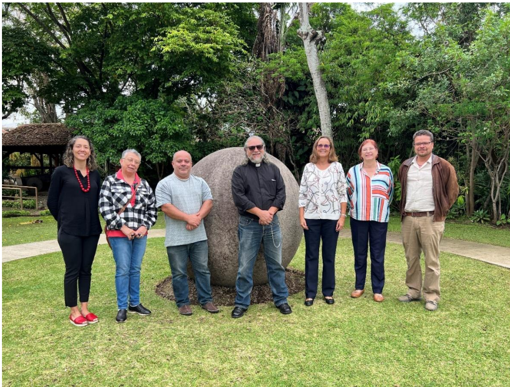
Museo Nacional de Costa Rica, 05 de mayo 2022